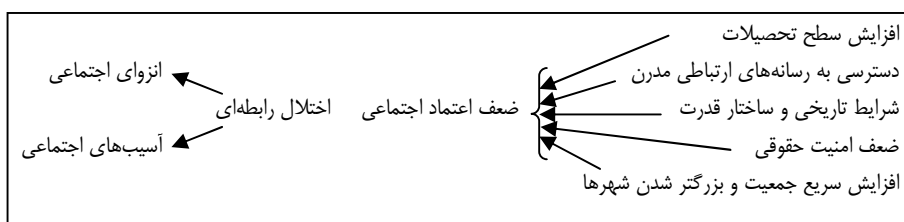
شکل (2): مدل مفهومی سرمایه اجتماعی و آسیب اجتماعی

شناسایی میزان و فرایند سرمایه اجتماعی در میان مردم جامعه می‌تواند به شناسایی روند تحولات اجتماعی و فرهنگی آن جامعه کمک زیادی بکند و نیز با مطالعه و شناخت دقیق سرمایه اجتماعی در میان اقشار اجتماعی مختلف می‌توان از این مفهوم و شاخص معتبر آن اعتماد اجتماعی در تحلیل مسائل اجتماعی و فرهنگی مانند انسجام اجتماعی، نظم اجتماعی، مشارکت اجتماعی و تقویت نهادهای مدنی به عنوان متغیر پیش‌بینی کننده بهره گرفت. آگاهی از این روند می‌تواند به برنامه‌ریزی اجتماعی و فرهنگی در انتخاب سیاست‌های اجتماعی و مدیریت اجتماعی و همچنین پیشگیری از آسیب‌های اجتماعی کمک شایانی بکند. این مطالعه جنبه توصیفی و تحلیلی دارد و منابع مورد استفاده در گردآوری اطلاعات عبارت از مطالعات کتابخانه‌ای و اسنادی و تحلیل داده‌های موجود است. سوال اصلی این بررسی این است: چه رابطه‌ای بین میزان آسیب‌های اجتماعی و سرمایه اجتماعی وجود دارد؟ فرضیه اصلی این مطالعه این است که بین سرمایه اجتماعی و میزان آسیب‌های اجتماعی در یک جامعه رابطه‌ای وجود دارد. هر قدر میزان سرمایه اجتماعی (اعتماد اجتماعی) یک جامعه کمتر باشد، میزان وقوع آسیب‌های اجتماعی نیز در جامعه بیش‌تر خواهد بود. مدل تحلیلی و مفهومی در شکل زیر ارائه شده است: